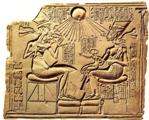
Abbildung 1: König Echnaton und Königin Nofretete mit ihren Kindern 9

ICH-SINN: Hobson beobachtet auch die Voraussetzungen dafür, dass diese „Kopernikanische Wende“ eintreten kann. Sie besteht darin, dass sich das kleine Kind schon vorher mit einzigartigem Interesse anderen Menschen zuwendet: „Von den ersten Lebensmonaten an nimmt es Menschen als Menschen wahr.“ 11 - hat es einen Ich-Sinn, kann man ergänzen.